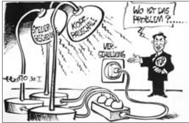
.... der Strom kommt aus der Dose! Zeichnung: Haitzinger

Als die Narren in dieser Woche Einzug im Kanzleramt hielten, baute Merkel dennoch schon mal vor, falls ihre schwarz-gelbe Mannschaft als Zielscheibe für karnevalistischen Humor dienen sollte: „Ich vermute, die Bundesregierung bietet diesmal auch ein paar Anregungen.“