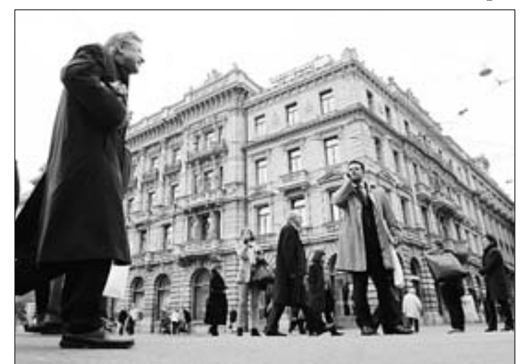
UNTER VERDACHT: Auch Kunden der Bank Crédit Suisse in Zürich sollen auf der CD stehen.

Andere Länder haben ebenfalls bereits großes Interesse an der CD signalisiert. Österreich hofft, Sünder im eigenen Land zu enttarnen. Die belgische Regierung will laut „De Standard“ ähnlich verfahren. Unklar ist weiter, welche Schweizer Banken betroffen sind. Die „Financial Times Deutschland“ berichtete, unter anderem geht es um Konten bei den Banken Crédit Suisse, Julius Bähr und HSBC.