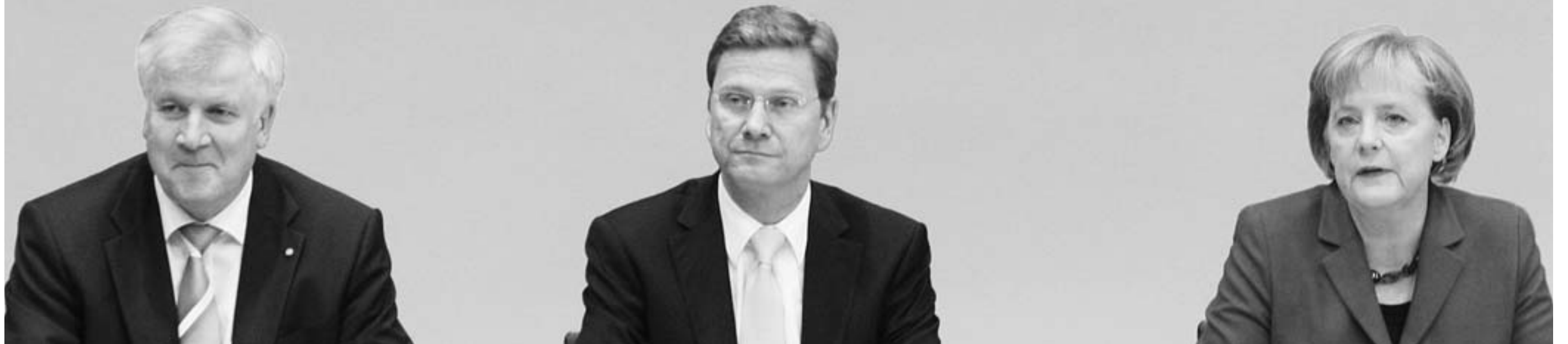
ERNST, ABER FROH: Die Parteichefs Horst Seehofer (CSU), Guido Westerwelle (FDP) und Angela Merkel (CDU) unterrichten am 24. Oktober 2009 die Öffentlichkeit über ihren Koalitionsvertrag.