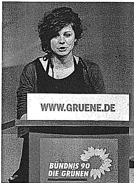
Grüne-Jugend-Chefin Akena Leitfaden für wohl situierte Bürger

Beispiel Ökosteuer. Als die Partei 1998 auf dem Magdeburger Parteitag eine schrittweise Erhöhung des Benzinpreises auf fünf Mark verlangte, wären die Grünen in der Bundestagswahl fast gescheitert.